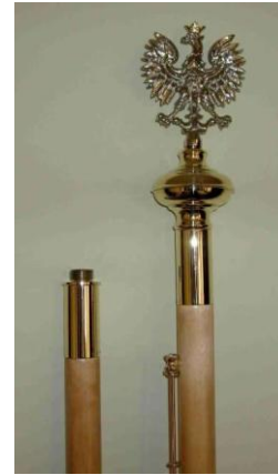
Rys. 4. Głowica z kulą