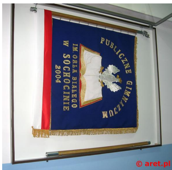
Rys. 2. Wnętrze gabloty - skrzydło otwierane do góry