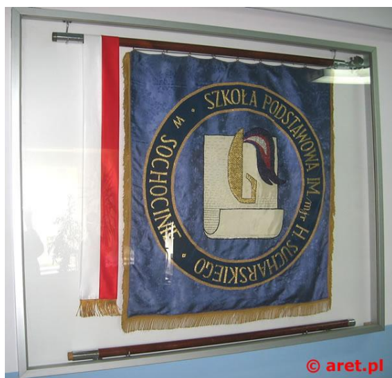
Rys. 1. Widok ogólny gabloty

Gabloty na sztandar wykonane są z profili aluminiowych. Skrzydło czołowe gabloty, otwierane do góry, posiada zamontowane dwa zamki bębnekowe i szybę z bezpiecznego metapleksu o grubości 4 mm. Dwa mocne podnośniki gazowe ułatwiają otwarcie gabloty i podtrzymują skrzydło. Wewnątrz gabloty zamontowane są dwa uchwyty do powieszenia sztandaru wraz z górną częścią drewnianego drzewca. Część druga (dolna) drzewca spoczywa na dwóch podpórkach. Uszczelka przyklejona do profilu zabezpiecza przed przedostaniem się kurzu do wnętrza gabloty. Odpowietrzenia na obwodzie gabloty sprawiają, że zarówno wewnątrz, jak i na zewnątrz gabloty panuje ta sama atmosfera.