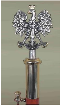
Rys. 3. Głowica płaska